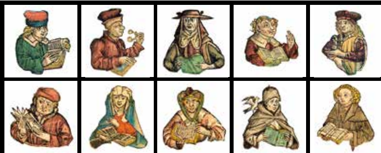
Bilder aus der Schedelschen Weltchronik 1493

Prüfeninger Straße 86 93049 Regensburg www.ambulanter-dienst-regensburg.de